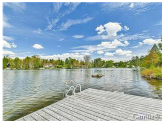
Bord de l'eau