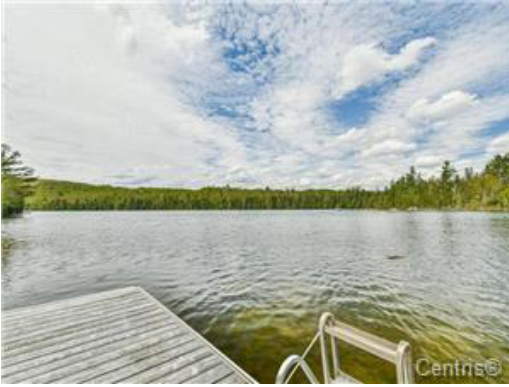
Bord de l'eau