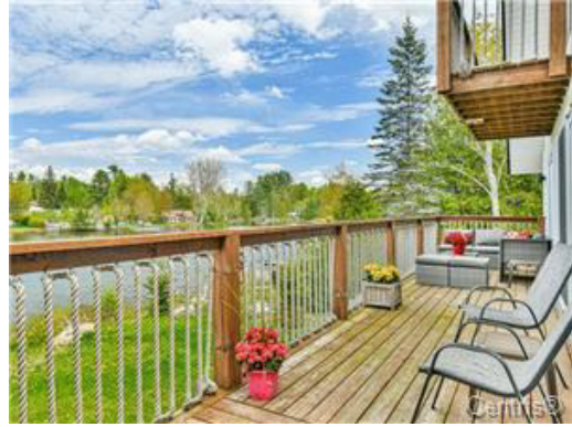
Vue sur l'eau