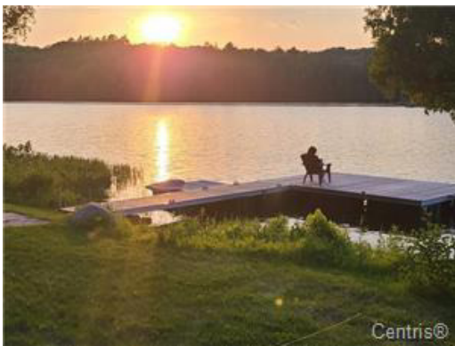
Bord de l'eau