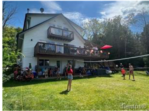
Bord de l'eau