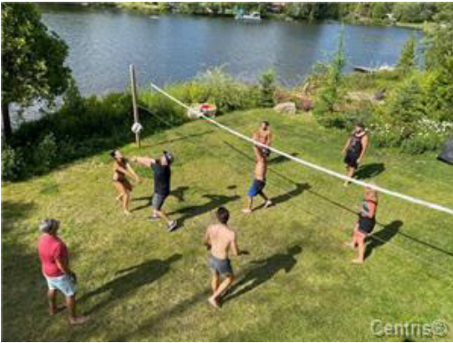
Bord de l'eau