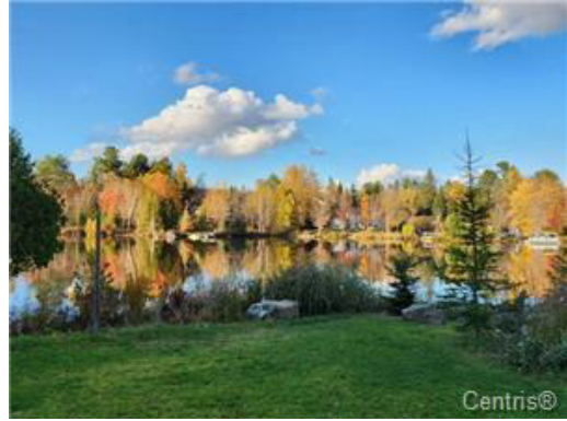
Bord de l'eau