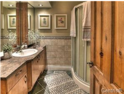
Salle de bains attenante à la CCP