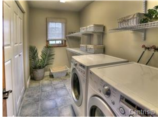
Salle de lavage