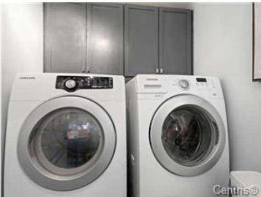
Salle de lavage