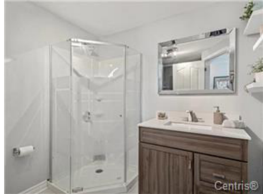
Salle de lavage