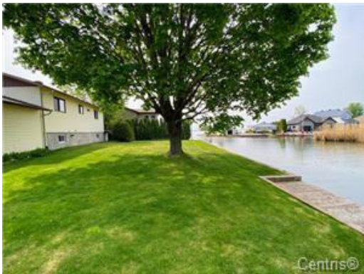
Bord de l'eau