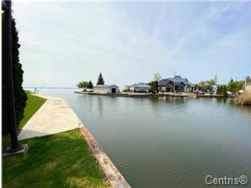
Bord de l'eau