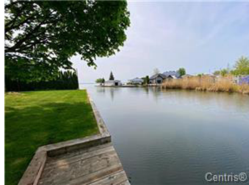
Bord de l'eau