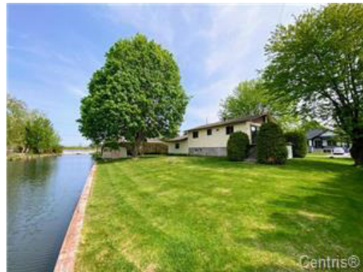
Bord de l'eau